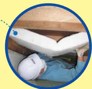
床下での断熱材設置作業のようす

床をはがさないから短期間であんしん施工。 施工後は、足元までぬくもりの行き届く、 暖房効率のよい暖かいお部屋で過ごせます!